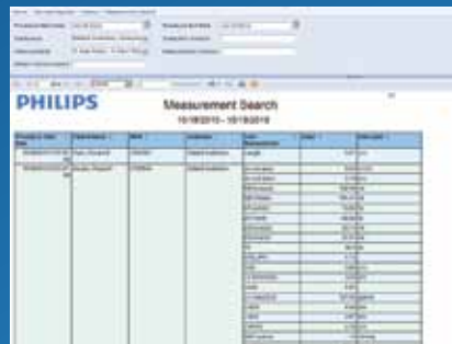
Verschiedene Möglichkeiten zur Effizienzsteigerung

Microsoft, SQL Server, Internet Explorer und Excel sind eingetragene Marken der Microsoft Corporation in den USA und/oder anderen Ländern.